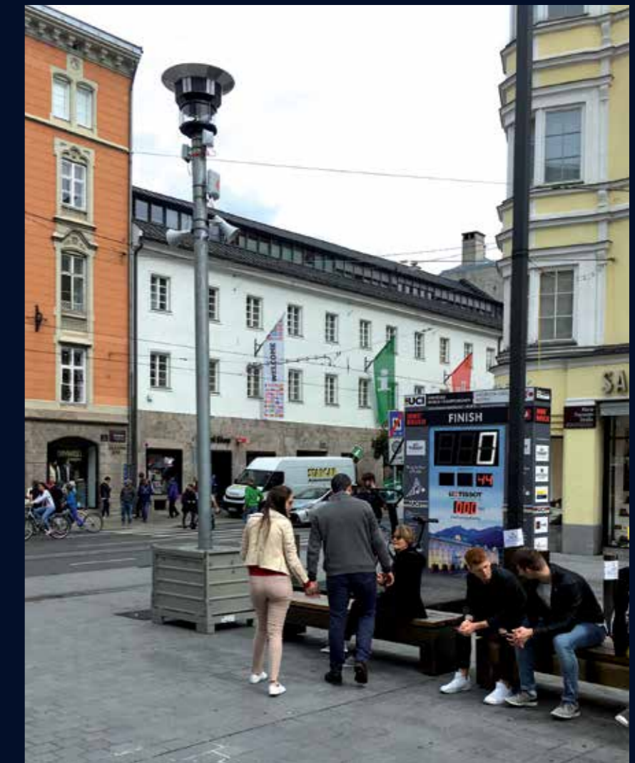
MOVETOS im Einsatz