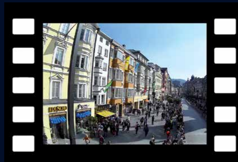
MOVETOS -Fußgängerzone (Besucher, Anwohner, Eventfläche)