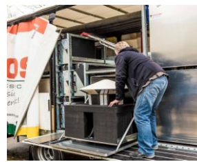
MOVETOS - Transportsystem