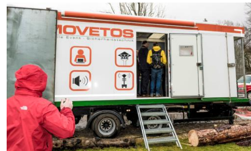
MOVETOS - Einsatzzentrale (Anhänger)