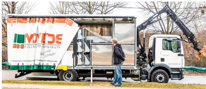
MOVETOS - Materialwagen (LKW)