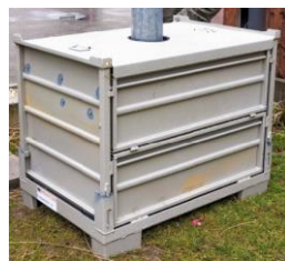
MOVETOS - Fundament