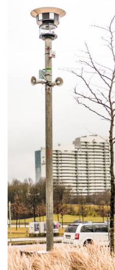
MOVETOS - Mastsystem